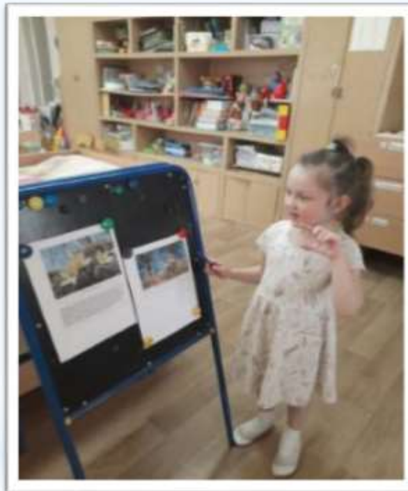
«Легенда о подснежнике»